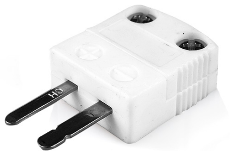
Miniature Hi-Temp Ceramic in-line Plug - HTC (dimensions in mm)

Labfacility are the UK's leading manufacturer of Temperature Sensors, Thermocouple Connectors and associated Temperature Instrumentation and stockings of Thermocouple Cables. The Company has been trading since 1971 and is ISO9001 accredited.