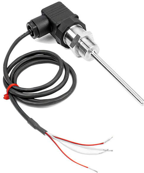
'HIRSCHMANN PT100 PROBE ASSEMBLY'